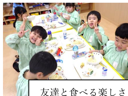
友達と食べる楽しさ