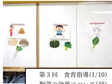
第3回 食育指導(1/10) 野菜の効果について(緑)