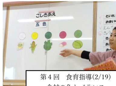
第4回 食育指導(2/19) 食材の色とバランス