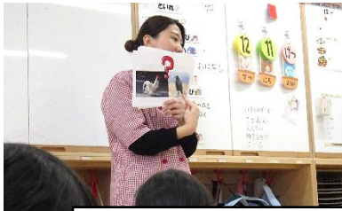
第2回 食育指導(12/11) 体をつくる赤の食材(肉)