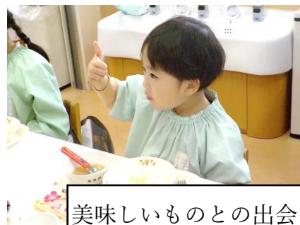
美味しいものとの出会い